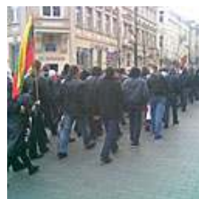
DELFI (A.Sarcevičiaus nuotr.)

kad ribos buvo peržengtos. 25 Konstitucijos straipsnis, mums laiduojantis teisę laisvai reikšti įsitikinimus, labai aiškiai sako, kad su ta teise nesuderinamas tautinės, rasinės neapykantos, prievartos ir diskriminacijos kurstymas. Tai yra nusikalstami veiksmai“, - kalbėjo D. Kuolys. Pašnekovo teigimu, policijos uždavinys yra aktyviai ginti civilizuoto bendrabūvio ribas. Tad policija, anot jo, turėtų gerai apsvarstyti savo veiklą viešojoje erdvėje ginant tokius Konstitucijos principus.