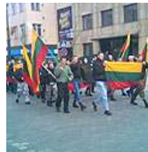
DELFI (A.Sarcevičiaus nuotr.)

Kovo 11-ąją eitynes Gedimino prospektu surengę, nacionalistinius bei rasistinius šūkius skandavę skustagalviai nacionalistai, dar vadinami „skiniais“, policijos pareigūnų nesudomino. Dviratininkus, kovotojus už Tibeto laisvę ar aplinkosaugą sulaikantys policijos pareigūnai „skinis“ tergino pasitraukti nuo važiuojamosios dalies.